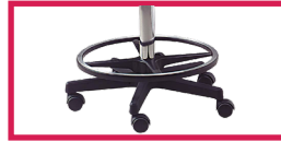
ACC 15 Repose pieds