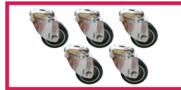
ACCROULETTE-02 5 roulettes simple galet diam. 50mm