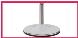
ACC 16 Pied sur socle chromé diam. 38cm (Enlève 1cm à la hauteur)