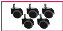
ACCROULETTE-05 5 roulettes auto-freinées en charge ou hors-charge