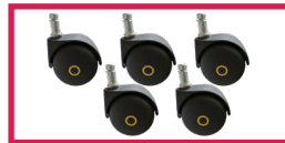
ACCROULETTE-04 5 roulettes antistatiques diam. 50mm